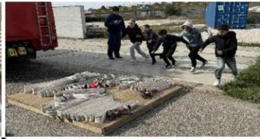
Diák Tűzoltóverseny – Encs