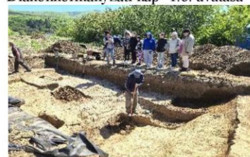
Ásatás – Tanulmányi kirándul – Gönc