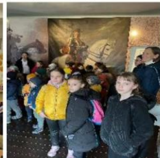
„Rákóczi 350” – Kassa