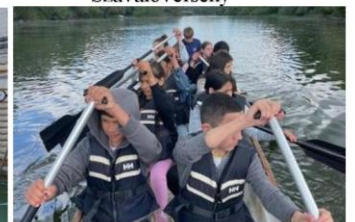
Éld+ Program - Sárkányhajózás – S.patak