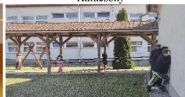
Számháború – Hemád hídi csata emlékére