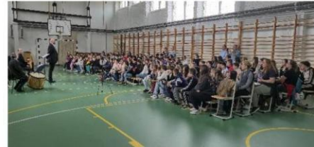
Lázár Ervin Program - zenei előadás