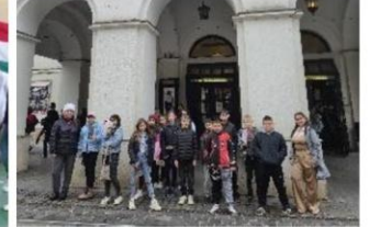
LEP – Miskolc Színház- János Vitéz