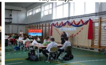
„Játsszunk matematikát” verseny