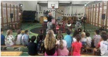
Lázár Ervin Program – Bábszínház