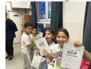
Óvd az egészséged! – vetélkedő, Gönc