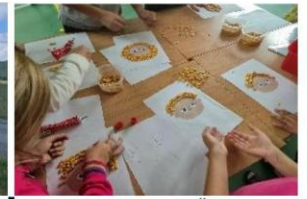
Kukoricázzunk! – DÖK program