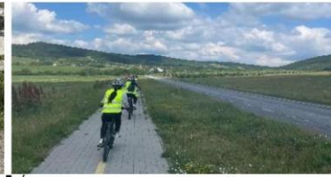
Éld+ Program – kerékpártúra - S.patak