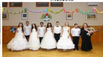
Farsang – keringő