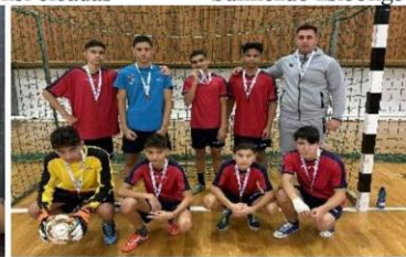
Diákolimpia – körzeti döntő