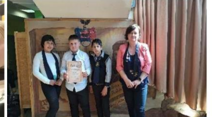
„Rákóczi 350” – történelem vetélkedő- S.patak