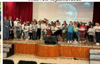
Rajzverseny díjátadó – Abaujszántó