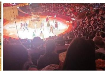
Lázár Ervin Program – cirkusz, Budapest