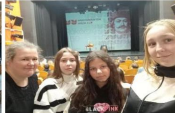
„Rákóczi 350” - Kassa