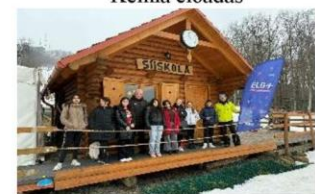
Sielés – Sátoraljaújhely