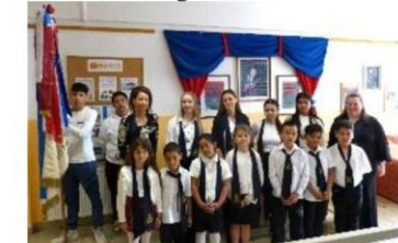
Diákönkormányzati nap- 1.o. avatása