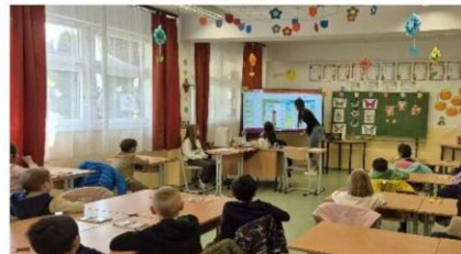
Hívogat az iskola!